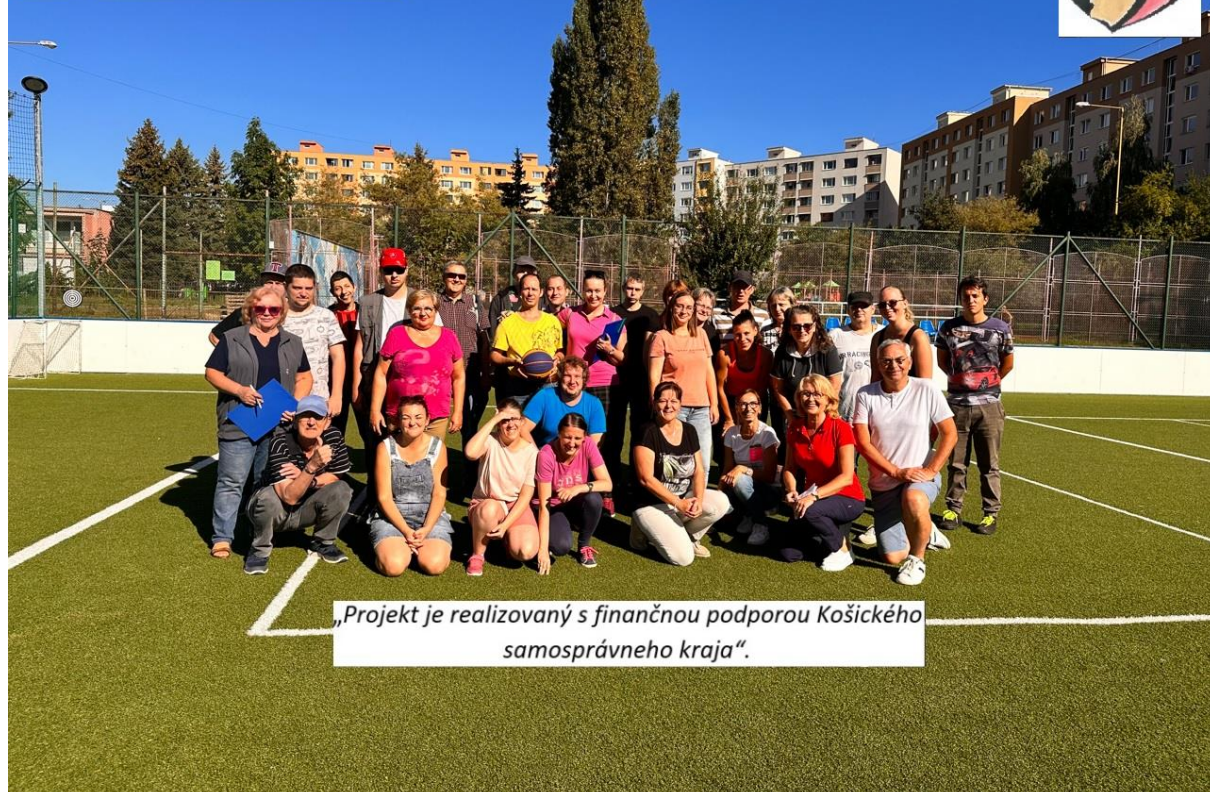
„Projekt je realizovaný s finančnou podporou Košického samosprávneho kraja“.