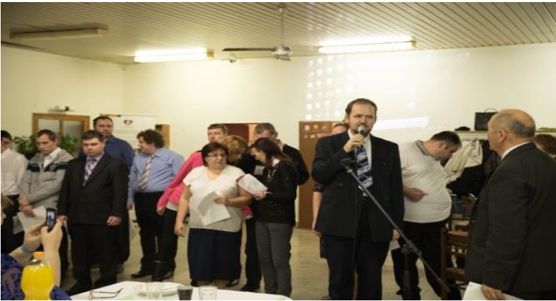
Impresie s harfou – Dom umenia – Verejná generálka – 9.2.2017