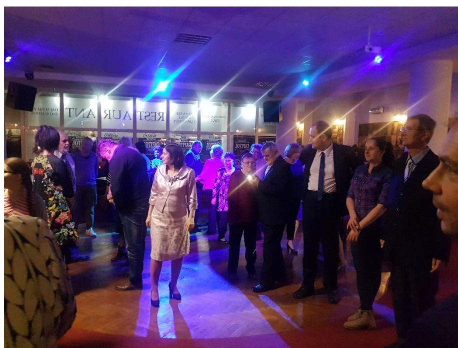
Fašiangová zábava, Február 2020