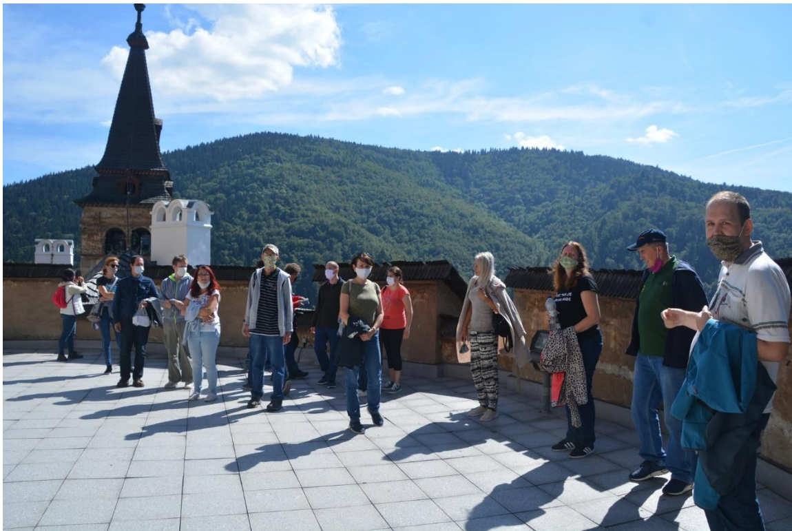
Oravský hrad, september, 2020 – Psychorehabilitačný výlet