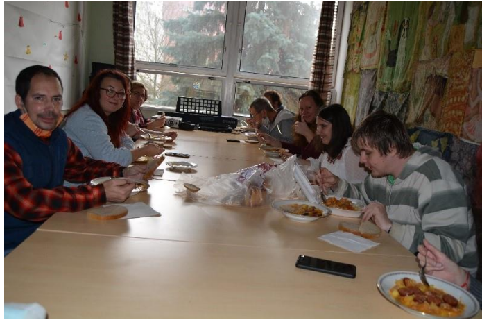
Kapustnica, Vianoce, 2020