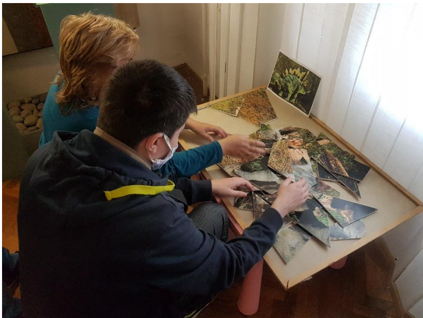
Návšteva Technického múzea, Košice, 2020