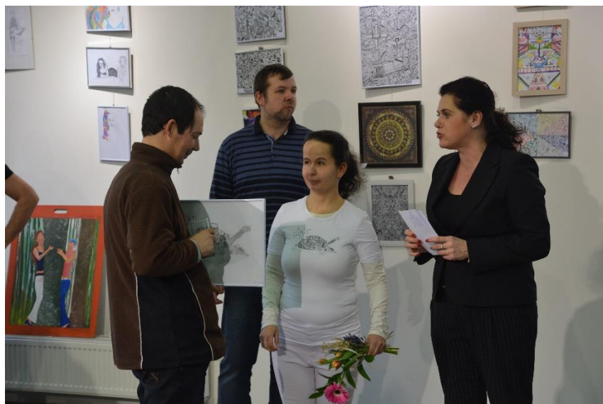
Vernisáž výtvarných diel klientov, Výmenník KVP