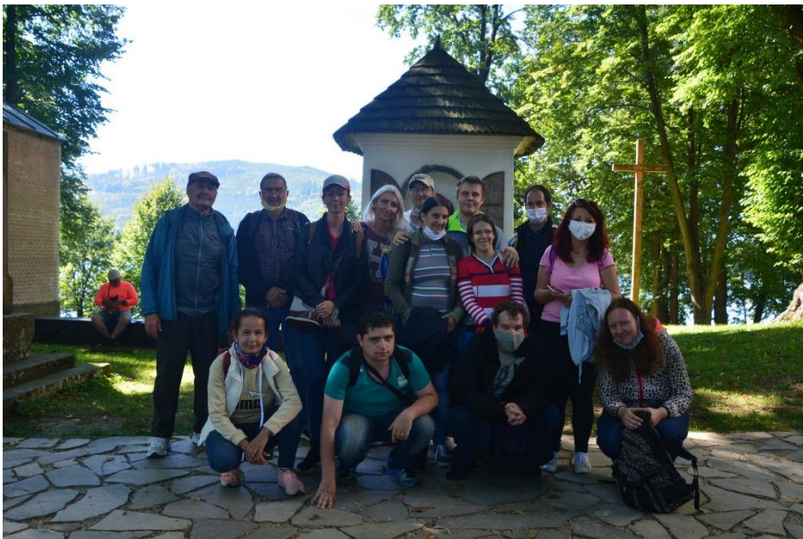
Slanický ostrov, September, 2020