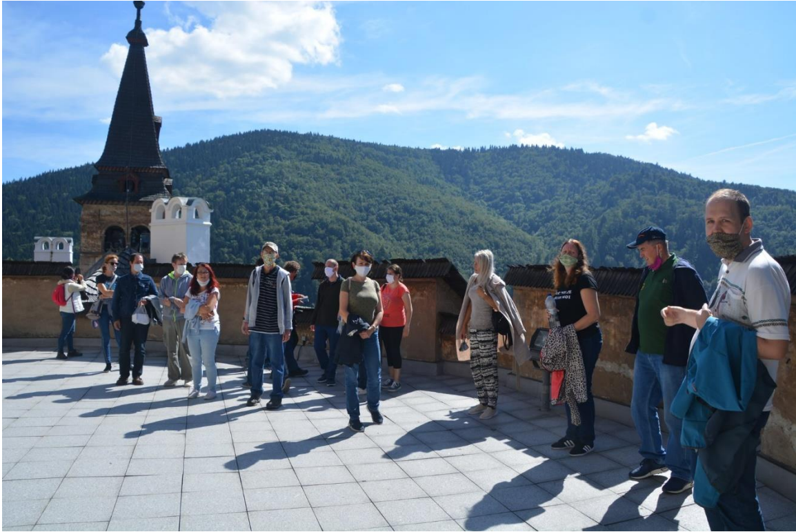
Oravská priehrada, hrad, September, 2020