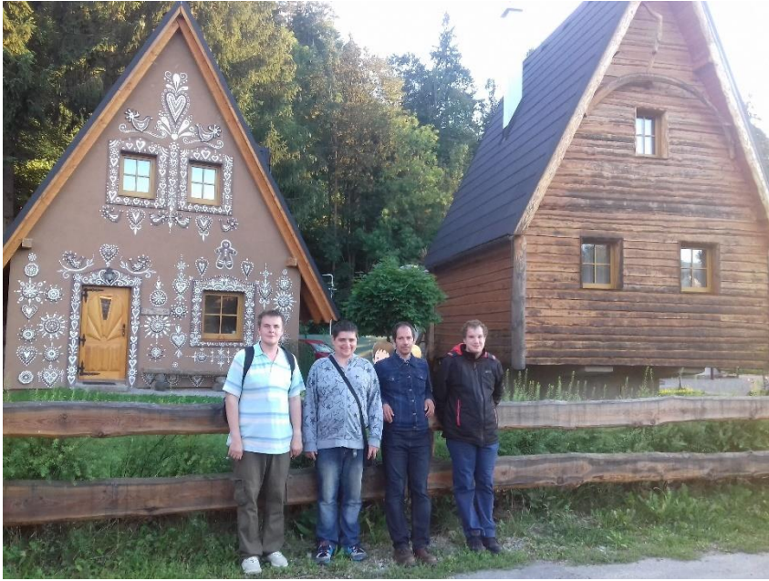
Dolný Kubín, September, 2020